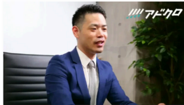
LPに手を抜くのはNG プロに聞く見込み客を逃さないリスティング 広告運用