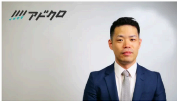
リスティング広告成功の鍵 専門家が語る「ニーズ把握」の重要性