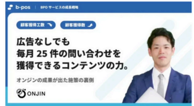
広告なしでも毎月25件の問い合わせを獲得できるコンテンツの力。 オンジンの「成果が出た施策の裏側」

発信するノウハウはSNSでも評判となり、同業者さんからも「わかりやすい」「参考になる」といった声が寄せられます。